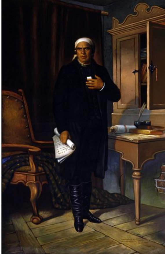
José María Morelos y Pavón