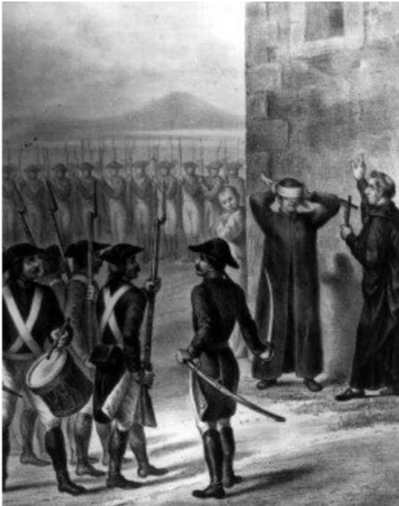
Pintura del fusilamiento de Morelos