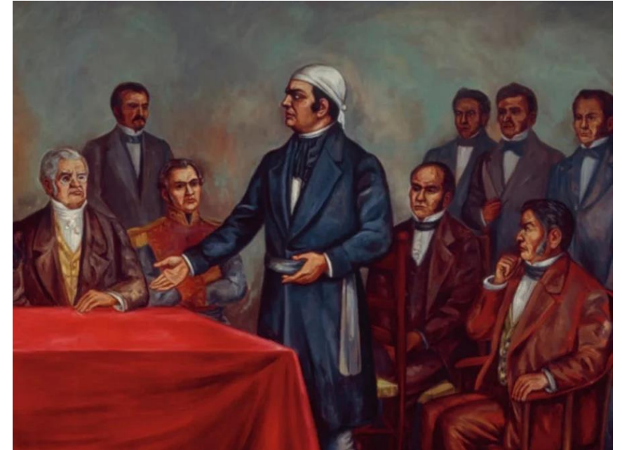
Morelos en el Congreso de Chilpancingo