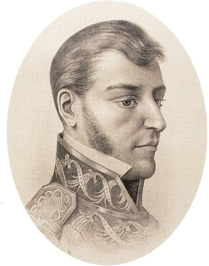
Ignacio López Rayón