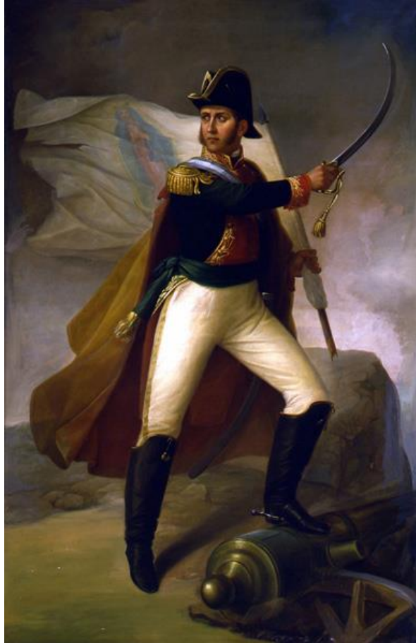
Ignacio Allende, teniente general del ejército insurgente