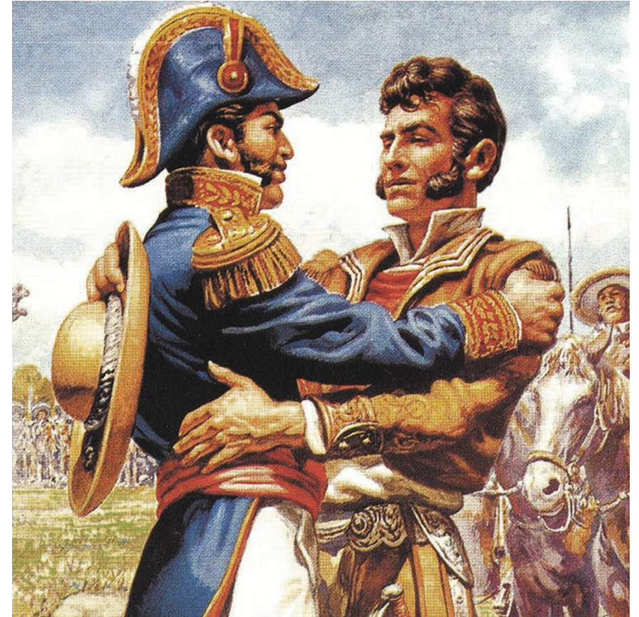
Abrazo de Acatempan (A la izquierda Iturbide y a la derecha Guerrero)