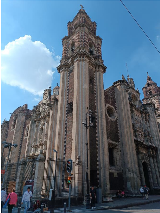
Templo de “La Profesa” en la Ciudad de México