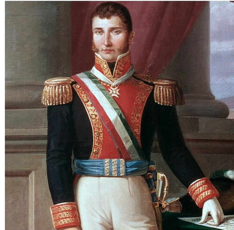
Agustín de Iturbide